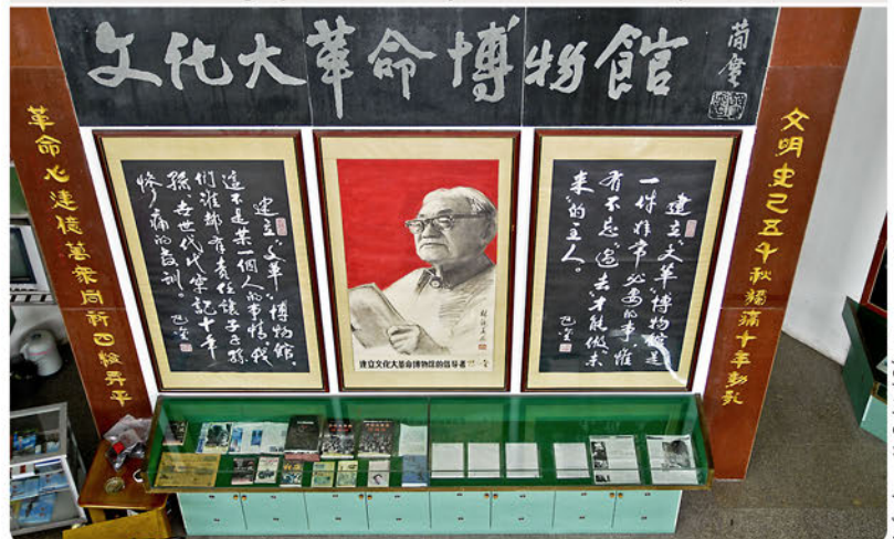
Bild 5: Bild und Kalligraphien des Schriftstellers Ba Jin in Tayuan.

Dieses Museum legt seinen Schwerpunkt auf die Opfer und Gewaltexzesse der Kulturrevolution. Dennoch bekräftigt auch der Initiator des Museums, der Bürgermeister Peng Qi'an ( Bild 6 ): „Wir zeigen, was passiert ist, wir reden auch von den Umständen, die damals geherrscht haben, doch genauer können wir den Dingen oft nicht nachgehen. Wir reden auch von den Tätern, vielleicht nicht ganz direkt, aber wenn man zwischen den Zeilen liest, versteht man schon, was wir meinen. Aber es stimmt, dass wir die tieferen Ursachen kaum ansprechen, denn bis heute ist es in China nicht ratsam, direkte Kritik an Mao Zedong zu üben“ (OPLETAL 2011, S. 71). Des Weiteren weist Peng Qi'an darauf hin, dass mit Anschuldigungen nur Gegenanschuldigungen provoziert, alte Gräben wieder aufge-