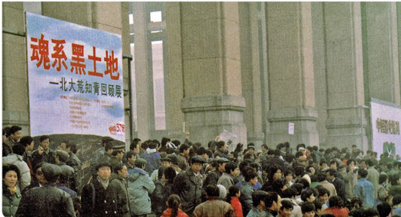
Bild 10: Institutionalisierung eines Generationsmythos: Eröffnung der ersten Ausstellung zur Landverschickung vom 25. November bis 09. Dezember 1990 unter dem Titel „Die Seelen sind mit dem schwarzen Land verbunden“ (hunxi heitudi) im Revolutionsmuseum in Beijing.