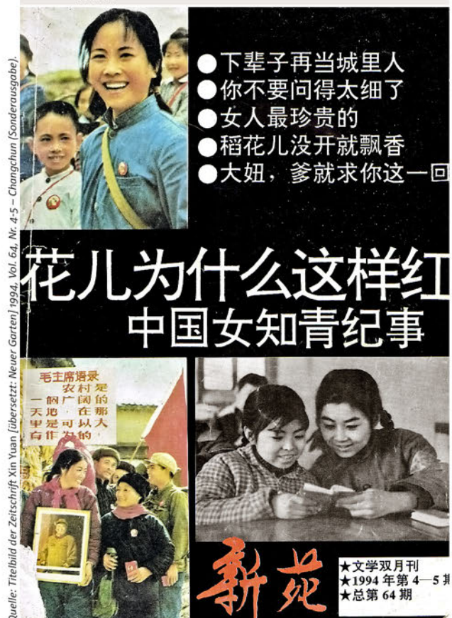
Bild 9: „Warum blühen die Blumen so rot?“ Titel der „Nostalgie“-Zeitschrift landverschickter Frauen, Erinnerungssays mit Überschriften wie „Ein Leben lang auf dem Land ansiedeln und dann wieder Stadtmensch werden“ oder „Das Wertvollste der Frauen“, 1994.