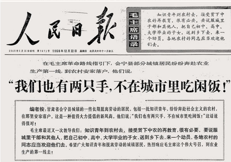
Bild 7: Der Zeitungsartikel mit dem Titel: „Wir haben auch zwei Hände, wir müssen nicht in der Stadt bleiben und Lärm schlagen!“, der am 22. Dezember 1968 die Massenbewegung einleitete und das Leben von einem Viertel der Stadtbevölkerung grundlegend ändern sollte.